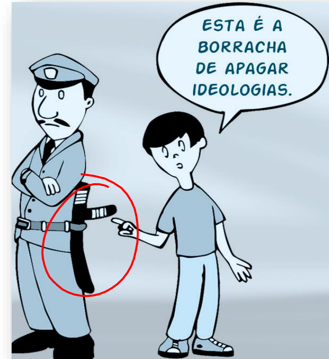
Figura 1.1: Sátira sobre como as ideologias, muitas vezes, são encaradas pelo Estado