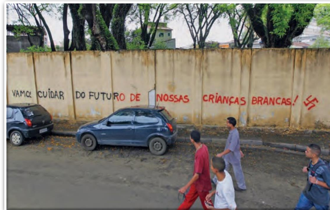
Inscrição preconceituosa na parede de uma escola municipal de São Paulo (SP, 2011).