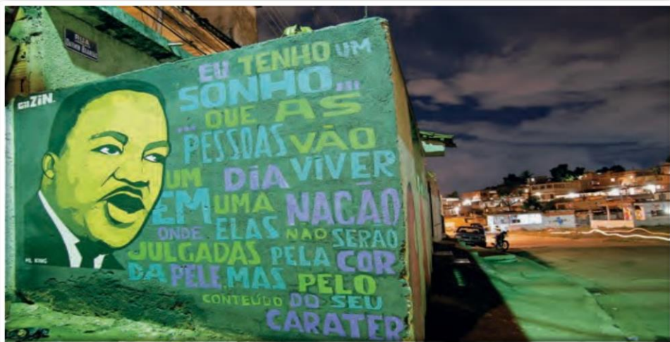
Grafite feito em celebração do Dia da Consciência Negra na comunidade da Divisa, em 20 de novembro de 2008. Rio de Janeiro (RJ).