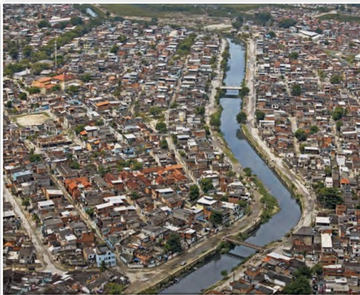
Imagem de 2011 do conjunto habitacional Cidade de Deus, que surgiu na década de 1960 como desdobramento das remoções de favelas localizadas no centro da cidade do Rio de Janeiro.