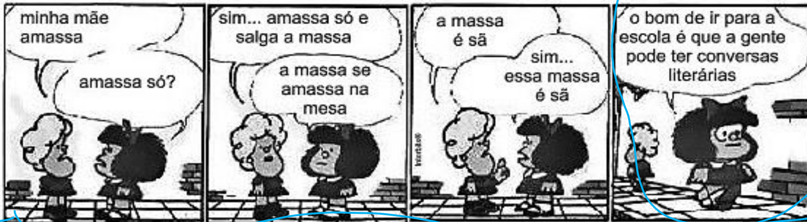
(QUINO, Toda a Mafalda, São Paulo, Martins Fontes, 1993)

4. No trecho “a gente pode ter conversas literárias ”, substituindo-se o sujeito por outro de primeira pessoa do plural , no tempo pretérito perfeito , o resultado é o seguinte: