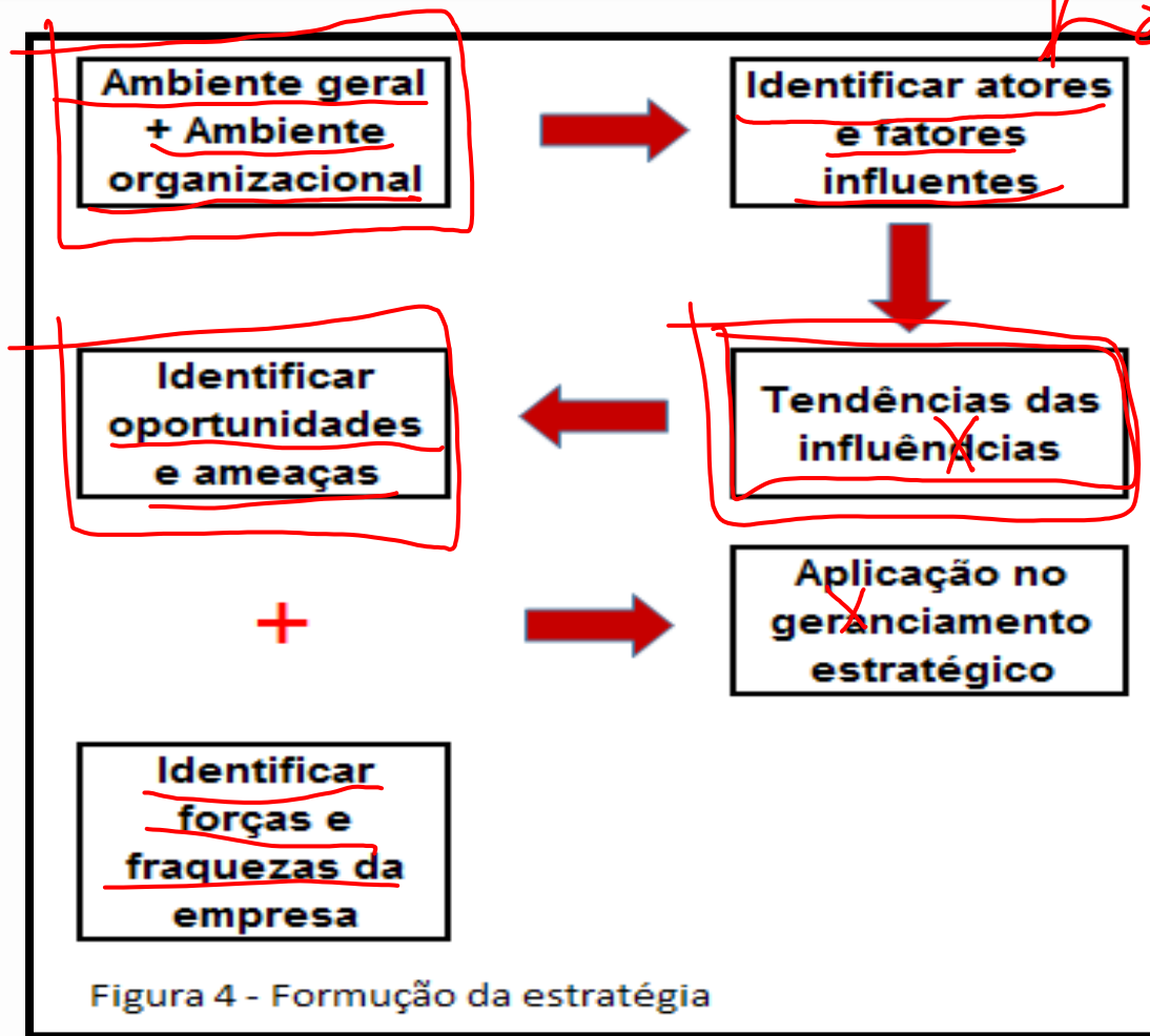
Figura 4 - Formação da estratégia