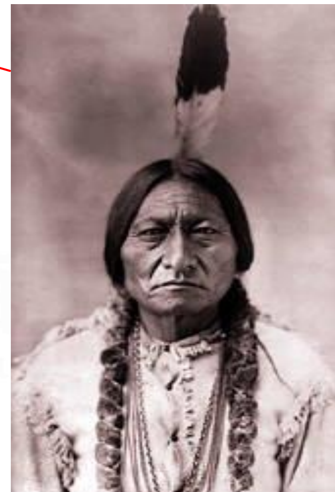
Índio Touro Sentado, importante chefe indígena dos sioux no século XIX