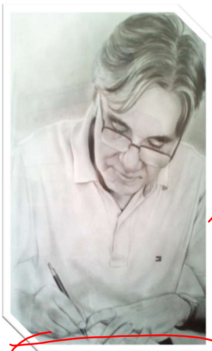
Arte de Rafael Davi