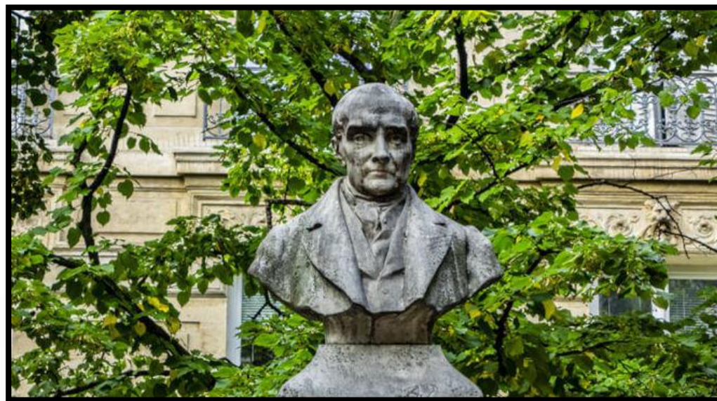
entre 20 e 23 de setembro de 2012.

Abaixo do nome de Augusto Comte está a pichação "merci pour tout", ou seja, "obrigado por tudo".