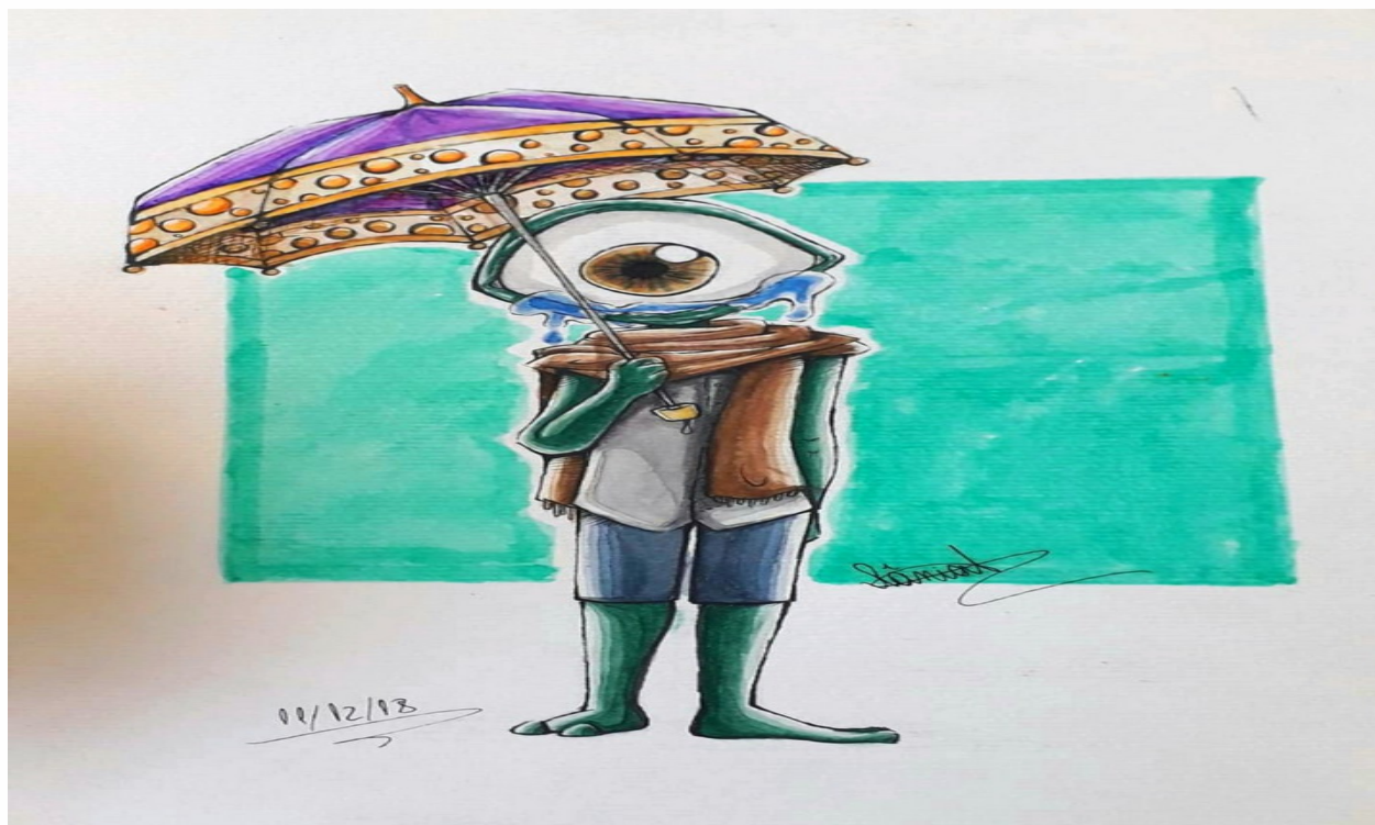
Desenho de uma aluna do Prof. Rufino

Tema: "A Democratização do acesso ao cinema."