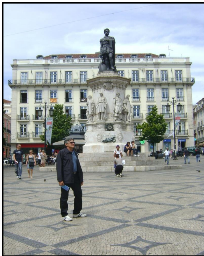
MONUMENTO A CAMÕES (LISBOA)

“Ouçam a longa história de meus males. E curem sua dor com minha dor; Que grandes mágoas podem curar mágoas.”