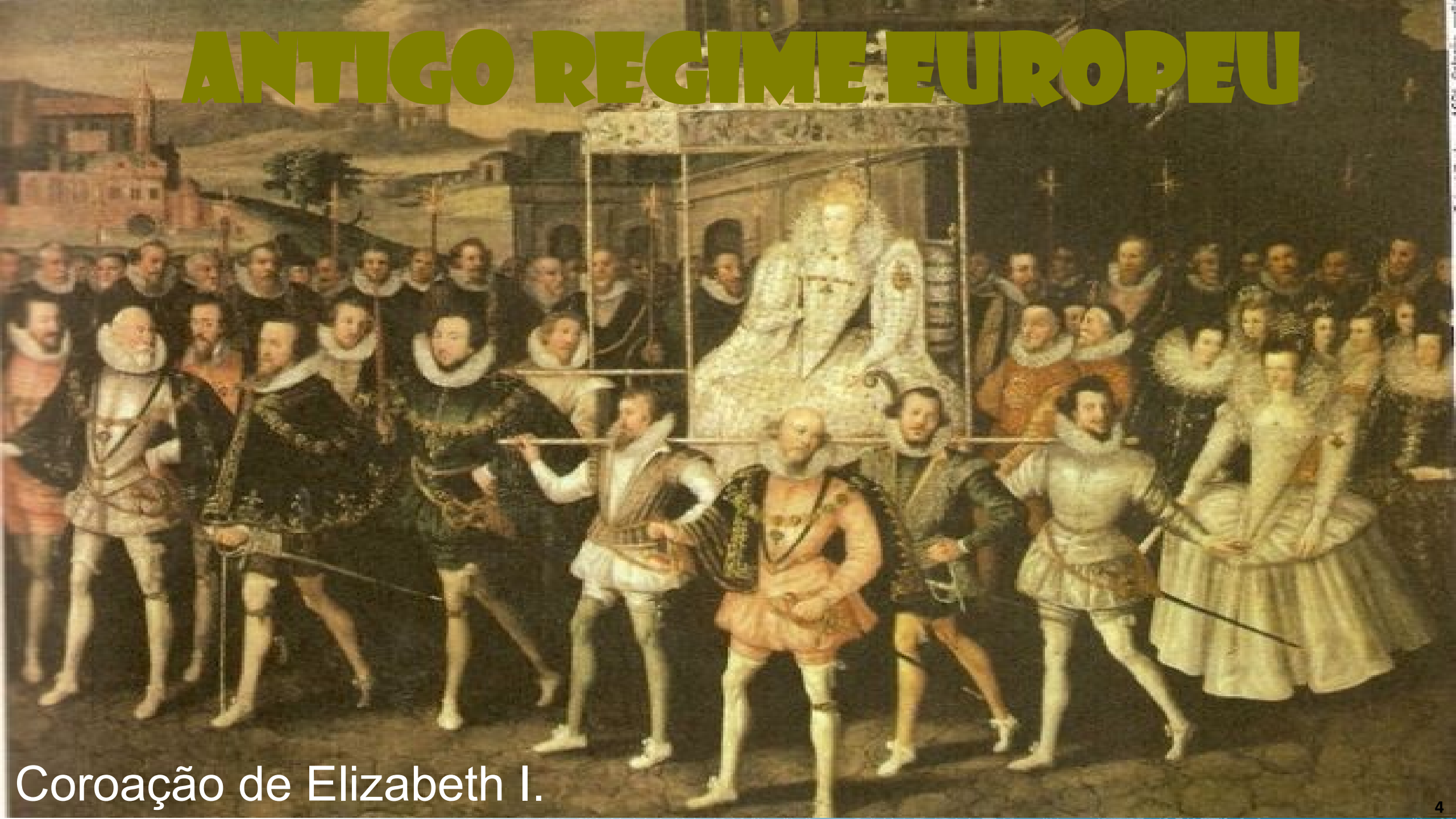
Coroação de Elizabeth I.