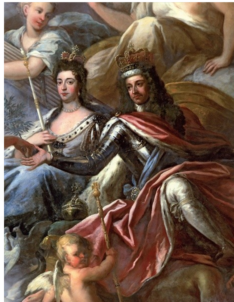
Guilherme III e Maria II