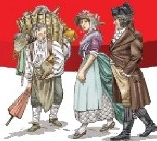
Terceiro estado (burguesia, trabalhadores urbanos e camponeses)