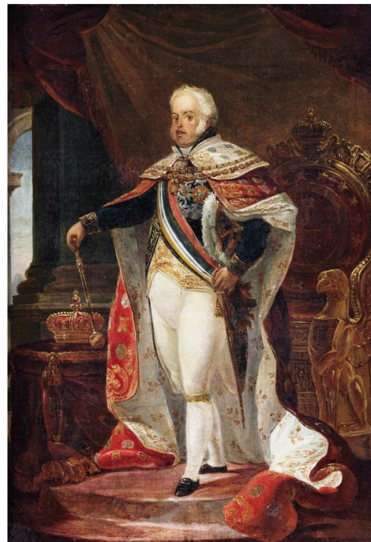
DOM JOÃO VI