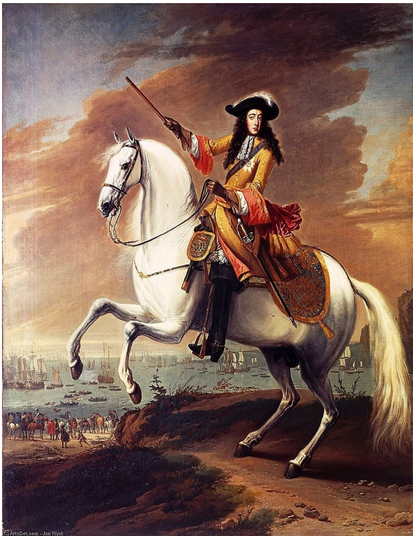
Retrato equestre de Guilherme III por Jan Wyck