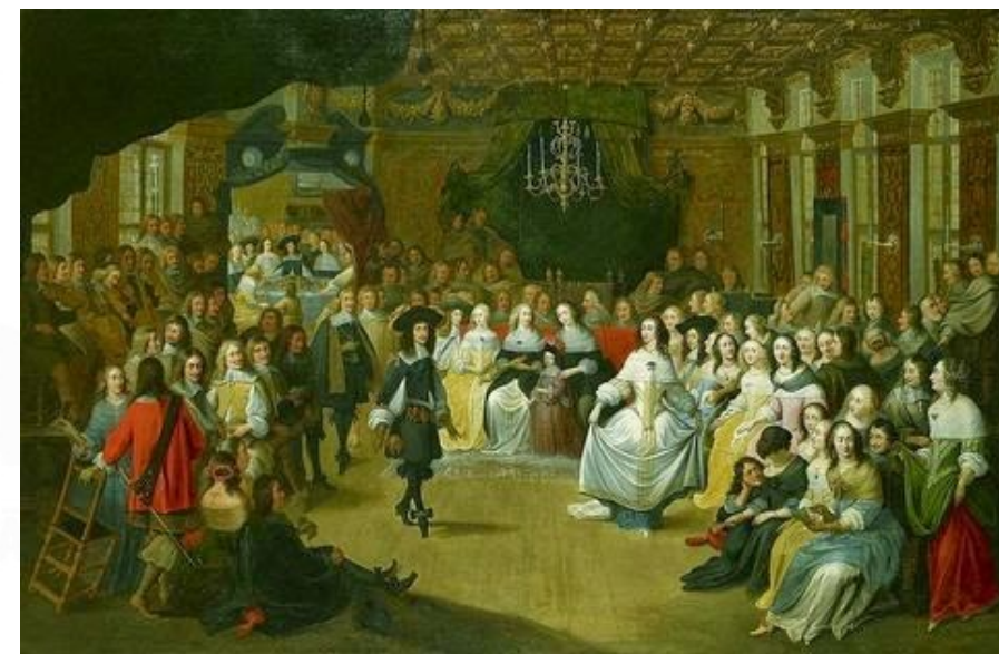
Carlos II dançando num baile na Corte. Hieronymus Janssens

SISTEMA POLÍTICO E SOCIAL CARACTERÍSTICO DA EUROPA NA IDADE MODERNA, ONDE O PODER POLÍTICO CONCENTRA-SE NAS MÃOS DO REI, QUE TEM COMO PRINCIPAL APOIO AS CLASSES DA NOBREZA E DO CLERO, QUE GOZAM DE AMPLOS PRIVILÉGIOS. O NOME ANTIGO REGIME SURTIU À ÉPOCA DA REVOLUÇÃO FRANCESA (1789).