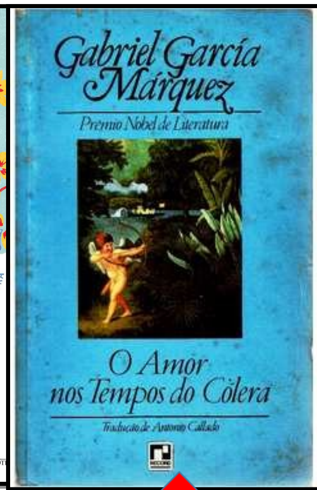
Tempo de ocorrência