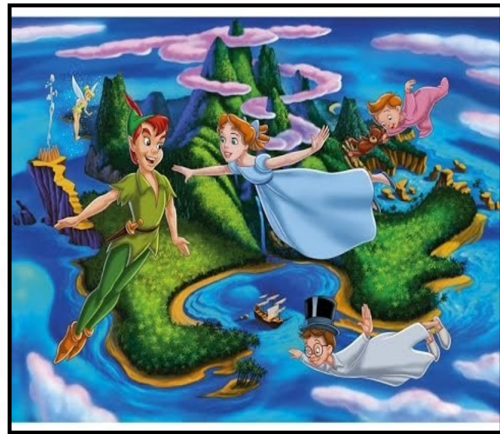
Peter Pan e a lendária Terra-Do-Nunca