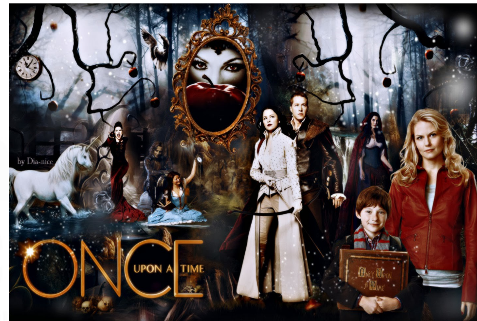
Série Once Upon A Time