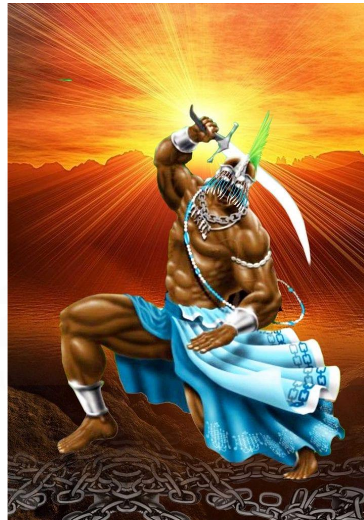
Ogum: Deus da Guerra