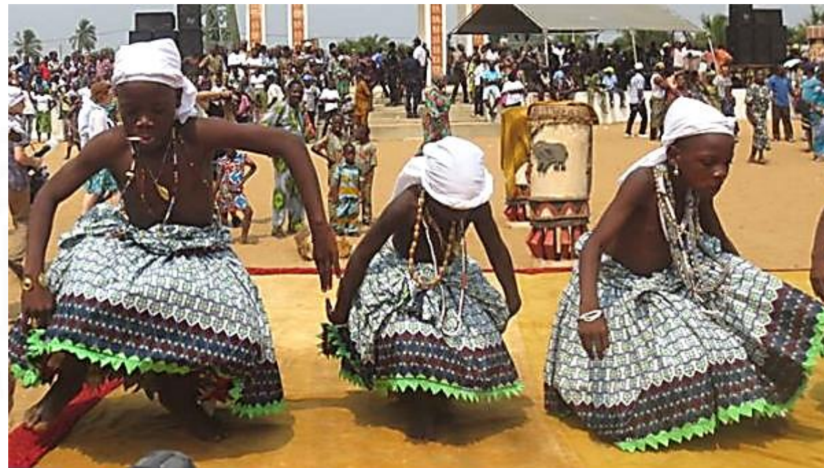
Festival de Vodum