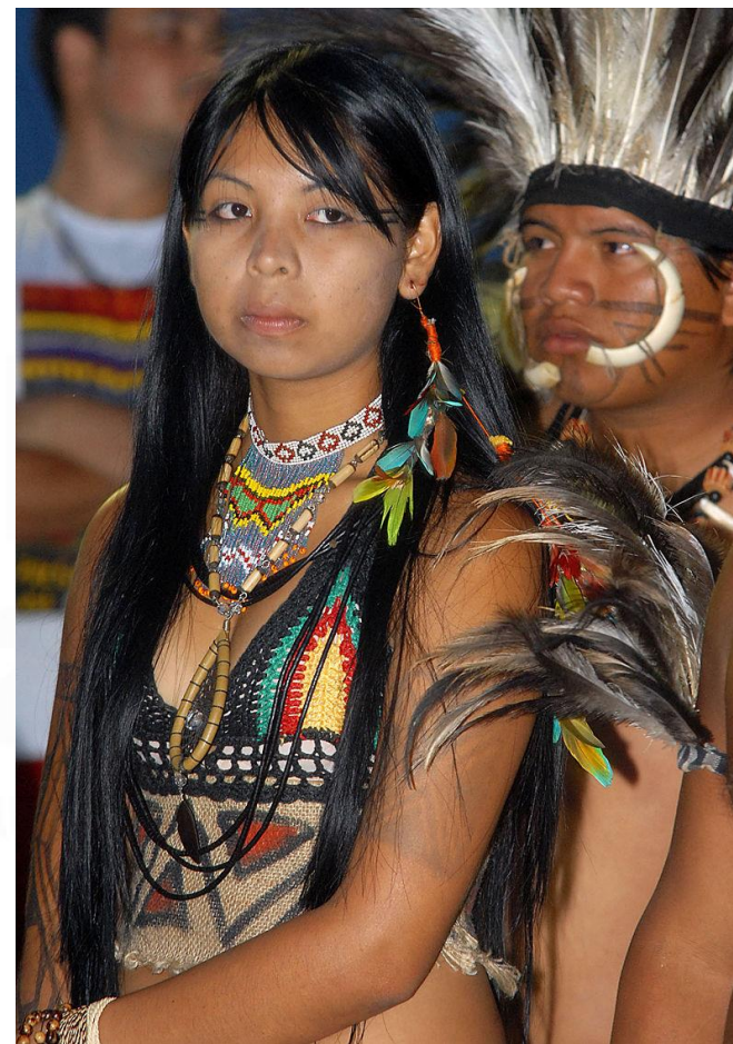
Índia da etnia Terena (MS)