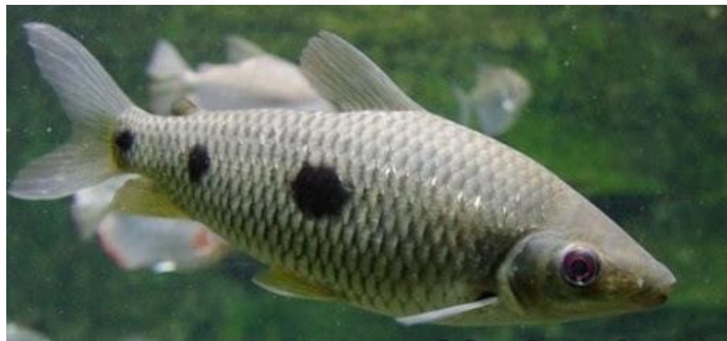
Piau - O Peixe que originou o nome do Estado do Piauí.