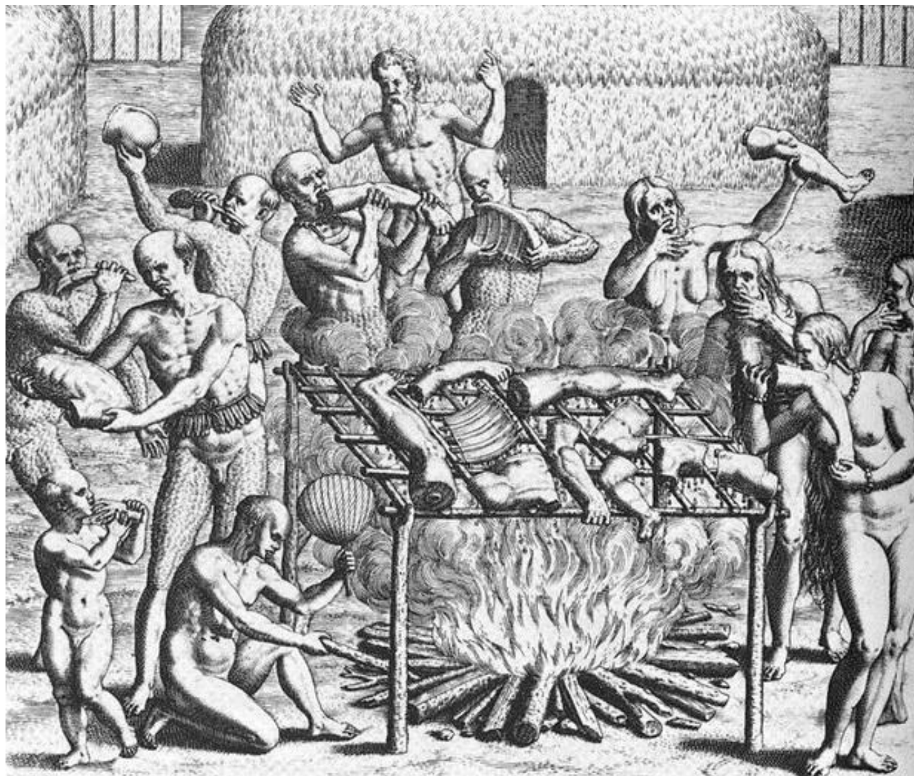
Ilustração de Hans Staden , 1557.